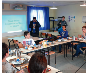
Repas et témoignages