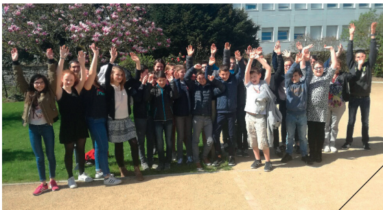
Un parcours collègue